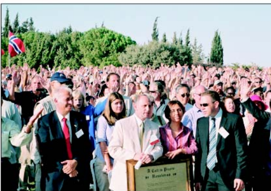
Knesset-Mitglieder, die am ersten Tag des Gebets für den Frieden Jerusalems - 3. Oktober 2004 - teilnehmen.

Versäumen Sie es bitte nicht, bei diesem historischen Ereignis dabei zu sein und für den Frieden Jerusalems und aller, die dort wohnen zu beten.