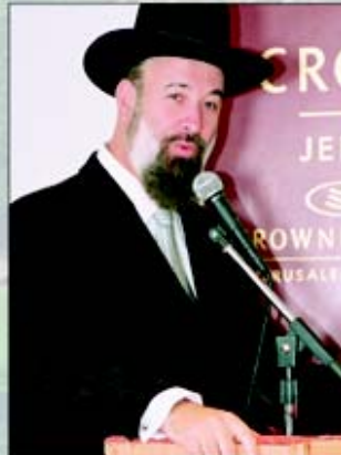
Haupttrabbiner Yona Metzger freut sich und dankt den Christen überall auf der Welt, die für den Frieden Jerusalems beten.