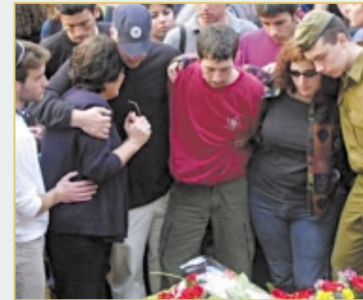
Israelis trauern bei der Beerdigung eines Teenagers, der Opfer des Terrors wurde

Jahrhunderten vorhergesagt wurde. Der Jerusalem Amos 9,11 Hilfsfond ist eine konkrete Möglichkeit für alle, die Zion lieben, Geld zu spenden, um positive Auswirkungen für das Volk Israel zu erzielen und um diejenigen zu unterstützen, die Israel beistehen. Bitte beten Sie darüber, wie Sie mithelfen können, Zion wieder aufzubauen!