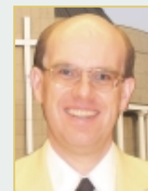
Christuskathedrale